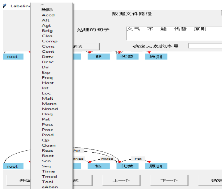
图 4.语义依存清单列表