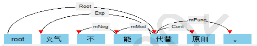
图 5.修改后的语义依存标注

经过分词检查和句法语义的校对修正后，就完成了对这个句子的句法语义标注，接着点击“下一个”，则系统会显示出文档中的下一个句子，依次类推，校对完所有句子的句法和语义标注。接着对标注结果进行统计，下文将进行分类阐述。