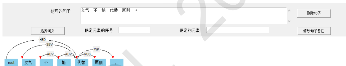
图 2.“义气不能代替原则”句法依存

通过“数据文件路径”导入含有目标句子的文档，点击“开始”，系统则会从导入的文档中的第一个句子开始显示其句法和语义标注关系图，以“义气不能代替原则。”为例，下图 2 显示的是句法依存。