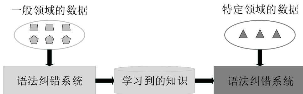
图 3. 语法纠错系统领域适应框架

Transformer (Vaswani et al., 2017)模型是基于多头注意力机制的seq2seq生成模型，如图2所示，它由编码器(Encoder)和解码器(Decoder)组成。其中编码器由 N 个相同的模块构成，即图2左侧部分，每个模块由两个网络层构成，分别是多头自注意力机制和全连接的前馈网络，两者之间都使用了归一化和残差连接。解码器同样是由 N 个相同的模块构成，即图2右侧部分，与编码器不同的是解码器中包含使用编码器输出进行运算的多头注意力层。编码器的作用是将输入序列编码为高维隐含语义向量，解码器根据上一时间步的输出，解码隐含语义向量作为当前时间步的输出，每个时间步的输出对应序列中的一个元素，所有时间步的输出拼接在一起作为最终的输出序列。王辰成et al. (2019)将各个模块的输出动态地结合到一起，以此来增强模型对语义信息的表达能力。