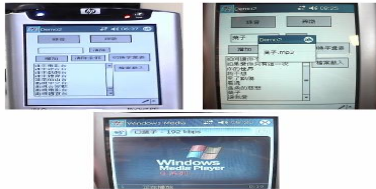
<圖三> 語音搜尋mp3播放機

主要的功能就是讓使用者減少搜尋MP3的時間，畢竟有時自己喜愛的歌一多，要找起來的費時許多，在這分秒必爭的時代裏，這將帶給人們不少的便利，所以操作介面以簡易操作、方便使用為主，輸入一段語音聲波後，經多語辨識引擎後，直接以Window Media Player播放之。如<圖三>所示。