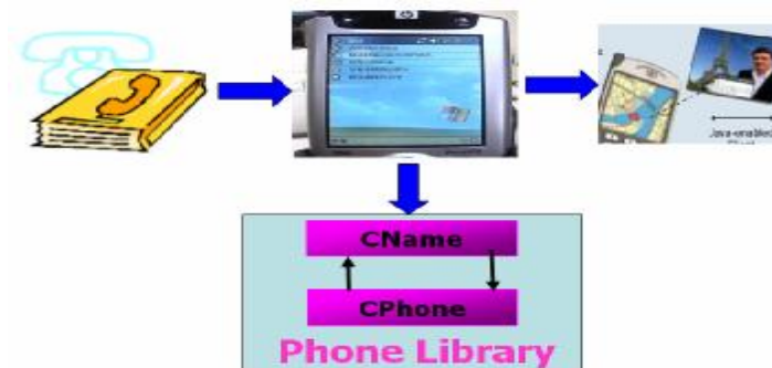
<圖五> 手機撥號示意圖

手機人名播號其實主要是要減少使用者尋找的時間而且可以Hands Free與Eyes Free，若你在開車時，可以增加很多方便的地方。這個主要只是將連絡簿與名字跟PDA的連絡人做個連接，我們以兩個class來實作完成它。如<圖五>所示。