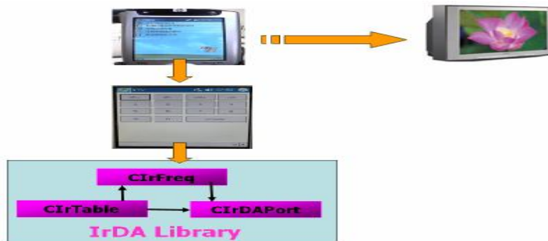
<圖四> 聲控電視示意圖

由於要控制紅外線與電視台名稱頻率對照表，以及各家廠商的紅外線頻率設定，我們以三個class來操作它們，以達到系統的強健性。如<圖四>所示。