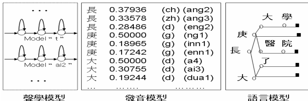
<圖一>. 三層次的語音辨識示意圖

在這裡我們提出的方法是用一階段搜尋方式來做華台雙語大詞彙的語音辨識，其是利用華台雙語都是對應到同一漢字書寫系統的特性來解決這個問題。當然這個方法也可以擴大到整個以漢字為書寫系統的語言上，如上海話、廣東話、四川話等等。不管說話者說的是華語還是閩南語或是上海話，語音辨識引擎都是將音轉成漢字，如<圖一>所示。最右邊的語言模型上用樹狀結構的漢字當作搜尋的節點，一來可以加速說尋的速度，二來在做華台雙語的辨識上在不用考慮到語言的問題，因為最後的輸出就是漢字，而不是音節。關鍵就在於<圖一>中間的發音模型；此模型記載了一個漢字所有可能的發音，不管是辭典上有的或是發音變異而產生的，都有其相對應的機率，因此這樣的架構下才能讓使用者在一句話中可以任意的說出華語或台語，而不會增加語言模型的負擔。而聲學模型的架構是不變的，只是在這裡有考慮到華台雙語統一標記與聲調的部分。底下我們就將聲學模型與發音模型做詳細的解說。