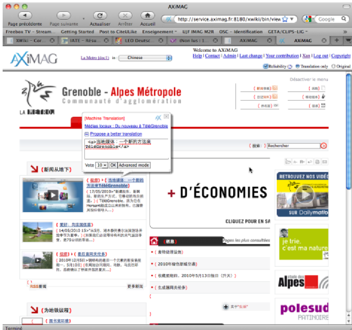
Figure 7: demonstration on the La Métro (Greater Grenoble) web site