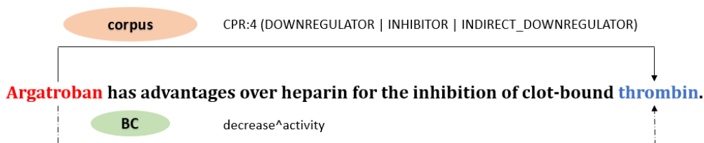
FIGURE 1 – Un exemple venant du corpus d'extraction de relations ChemProt (Krallinger et al. , 2017). Une relation "CPR:4" est annotée dans la phrase entre Argatroban et thrombin ; on trouve une relation "decrease^activity" entre ces entités dans la BC externe CTD (Davis et al. , 2023).

L'extraction de relations est une tâche importante du traitement automatique des langues sur laquelle de nombreuses études existent. Elle consiste à identifier le type de relation entre une paire d'entités étant donné une phrase entière. Un exemple d'extraction de relations est montré dans la figure 1 : l'objectif est de déterminer quelle relation existe entre Argatroban et thrombin , par exemple CPR:4 .