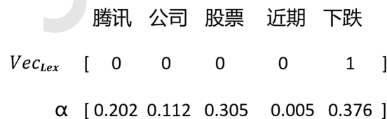
图 2. 金融领域情感词向量示意图

为了使用构建的金融领域情感词典，对于一个输入的分词后的句子，构建了一个与分词后的句子长度相同的情感词向量，称为 Vec_{Lex} ，并初始化为0。遍历输入金融文本中的词语若其出现在金融领域情感词典中，则在情感词向量中将对应位置设为1。为了更方便的理解金融领域