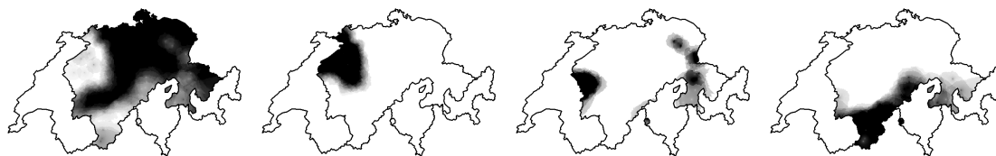
FIG. 3 – Transformation du nd final dans le mot Hund (SDS II/120). La prononciation nd est maintenue dans la plupart des régions de Suisse allemande (carte en haut à gauche). ng ([ŋ] en écriture phonétique) est utilisé dans la région de Berne (carte en haut à droite). n est utilisé dans la région fribourgeoise et dans quelques régions du Sud-Est (carte en bas à gauche). nt est limité aux régions alpines (carte en bas à droite).