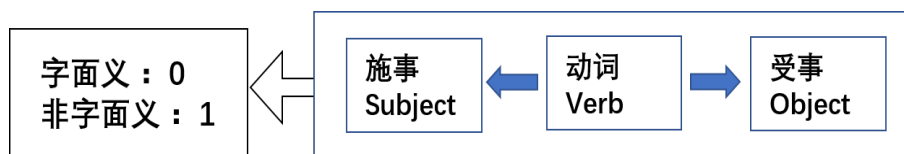
Figure 1: 隐喻标注规范

动词隐喻主要是动词的用法由字面义转为非字面义而产生的隐喻。原因在于动词的接续关系发生了变化，动词的接续关系存在两种，一是主谓关系，二是动宾关系。动词的转义往往都是因为接续的名词是抽象名词，而动词的字面义往往都是接续具体的名词，接续的名词是否为抽象名词变得很重要。因此根据这个特性，依据句子结构进行标注，可以更好地观察动词的隐喻现象，如图1所示。