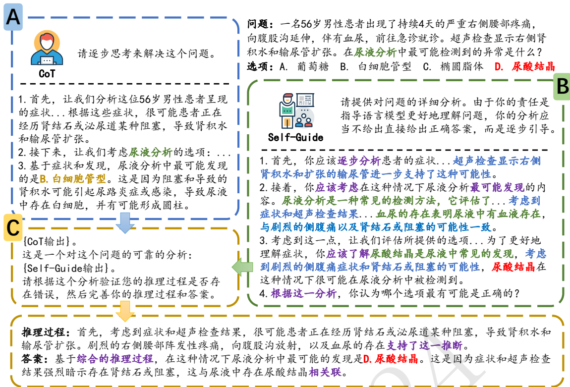
Figure 1: Self-Guide模型概述。模型分为思维链模块（Step A），基于大语言模型的自适应问题规划方法（Step B）和基于问题规划的大语言模型推理增强方法（Step C）。其中背景知识（Knowledge）、问题理解（Understanding）和问题规划（Planning）对应内容已高亮显示。

让大语言模型为问题的解决方案形成规划。对于给定的问题 Q ，语言模型生成规划Guideline。具体来说，它提供了基于大语言模型自身经验的指导方针，帮助语言模型减少推理过程中无关的认知负荷，从而将其注意力重新集中在推理过程上。对于给定问题 Q ，我们通过大语言模型生成任务解决规划：